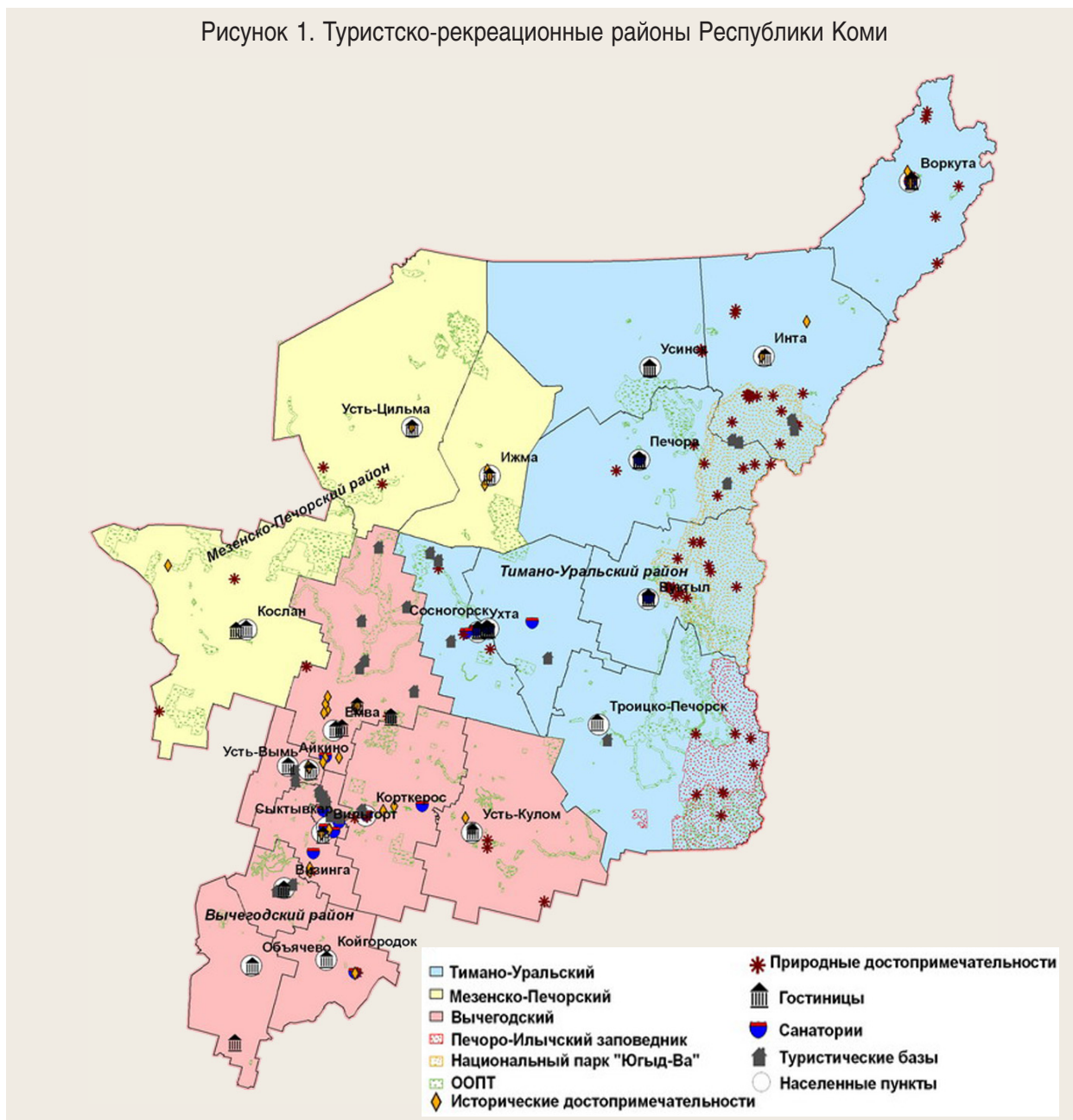
Рисунок 1. Туристско-рекреационные районы Республики Коми

потенциальные туристские центры. Важными направлениями проектной деятельности по созданию туристического сектора региональной экономики являются: