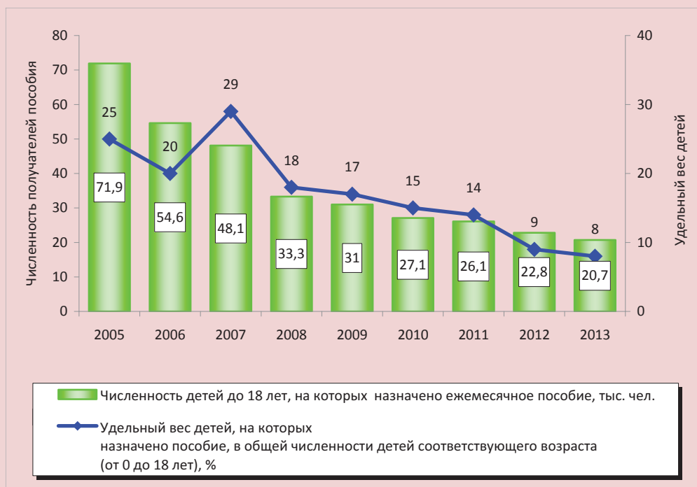
Рисунок 2. Численность детей до 18 лет, на которых назначено ежемесячное пособие, и удельный вес детей, на которых назначено пособие, в общей численности детей соответствующего возраста в Республике Коми за 2005–2013 гг.

лет) вырос с 297,62 до 637,6 руб., т.е. на 339,98 руб. Ежегодно размер пособия в среднем увеличивался на 37,77 рублей, а ежемесячно — на 3,14 рубля.