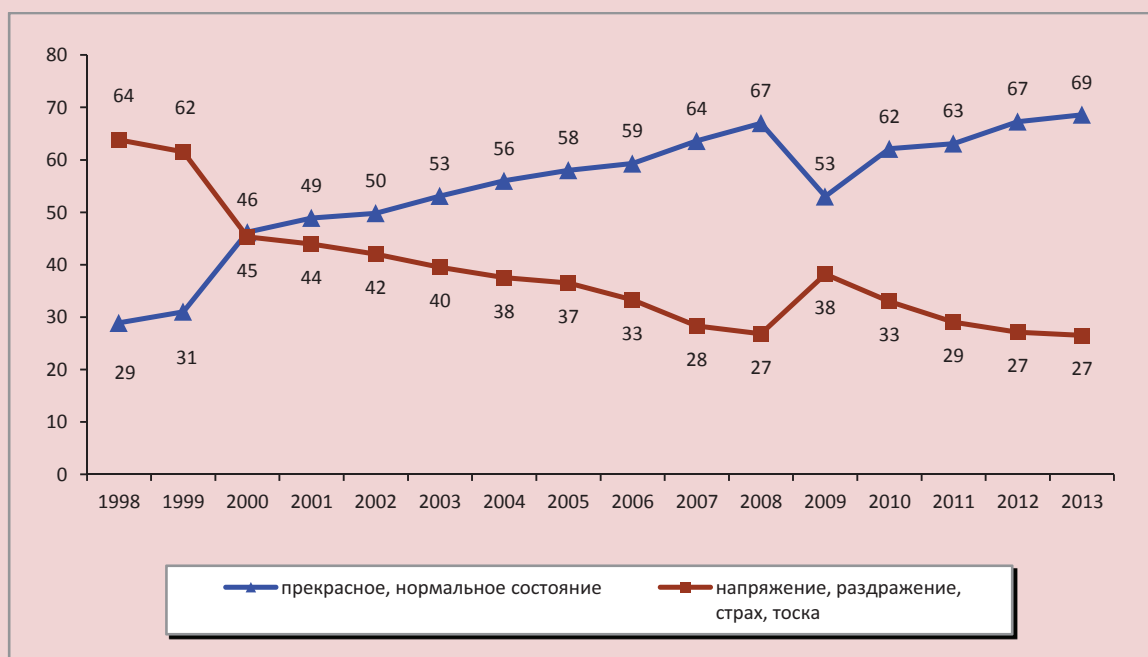
Рисунок 1. Динамика психологического состояния населения Вологодской области в 1998–2013 гг. (в % от общего числа респондентов)