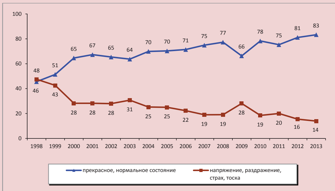
Рисунок 3. Динамика психологического состояния 20% наиболее обеспеченных жителей Вологодской области в 1998–2013 гг. (в % от общего числа респондентов)