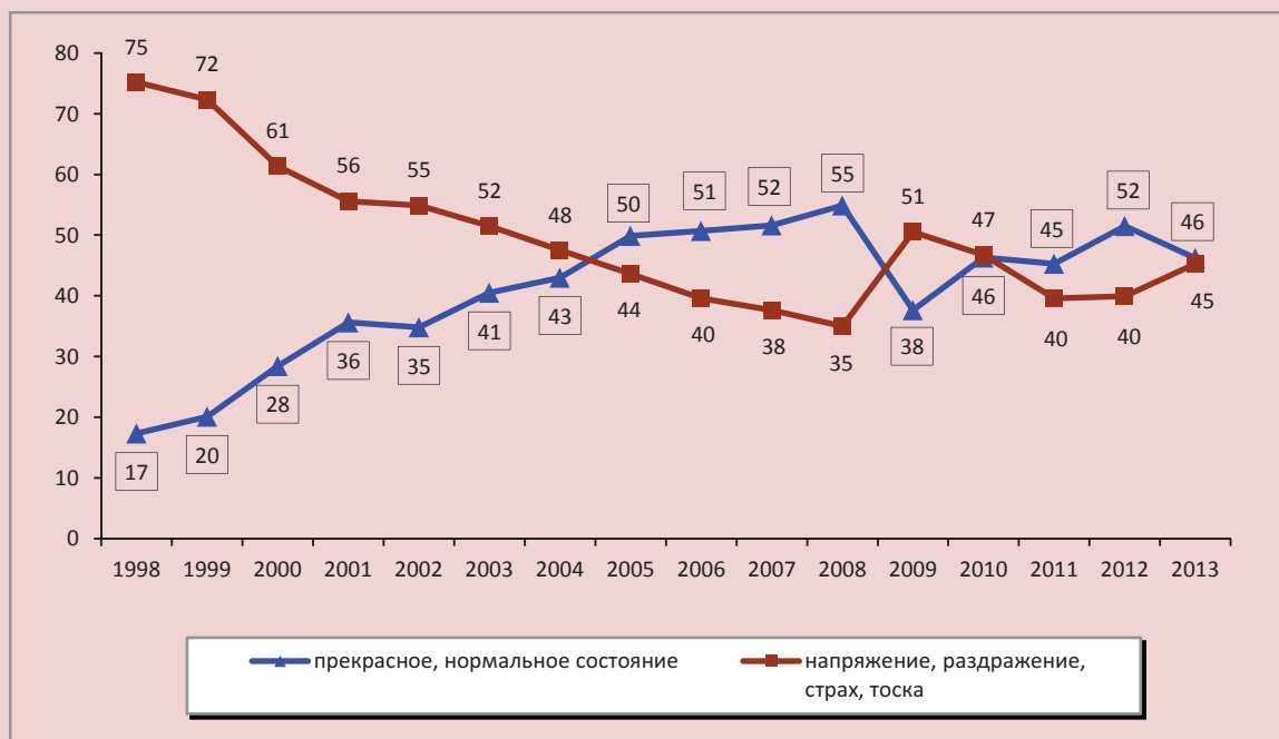
Рисунок 2. Динамика психологического состояния 20% наименее обеспеченных жителей Вологодской области в 1998–2013 гг. (в % от общего числа респондентов)

Примечание. Рамкой выделены данные по варианту «прекрасное, нормальное состояние».