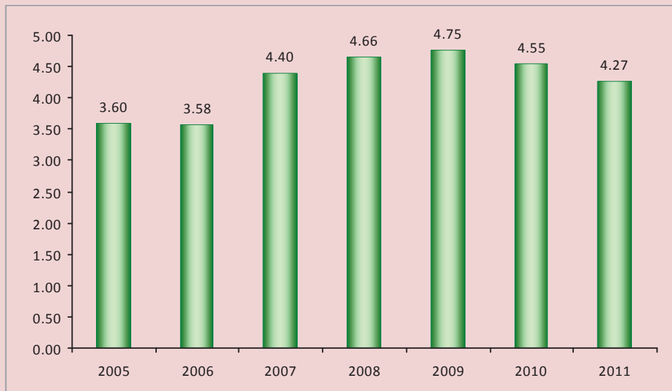
Рисунок 2. Удельные выбросы загрязняющих веществ в воздух на 1 тонну добытого угля в Кемеровской области, кг

Все это обусловлено перемещением огромных масс почвы, горной породы, полезных ископаемых на больших площадях, промышленными взрывами, резко меняющими окружающую среду. Для других отраслей промышленности подобное воздействие нехарактерно, они «ограничиваются» в основном сбросом загрязняющих веществ, а также термическими загрязнениями. Это также следует учитывать, оценивая возможность реализации эффекта декаплинга в данной отрасли.