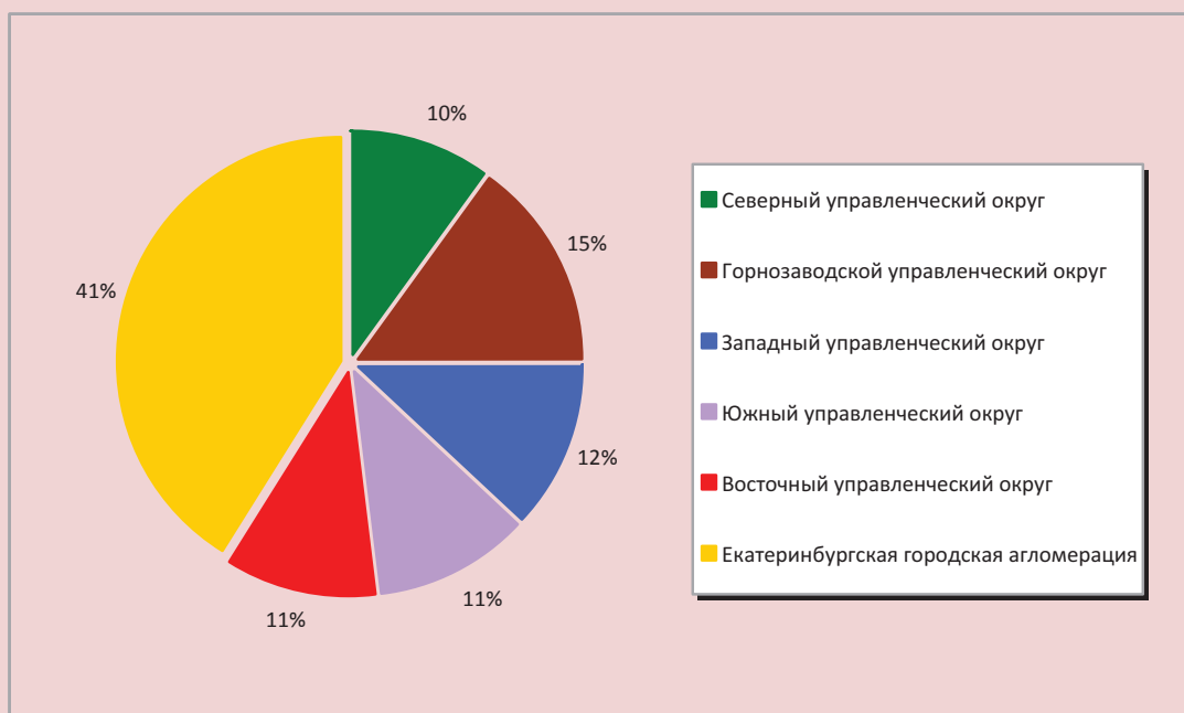
Рисунок 3. Территориальная структура населения Свердловской области в трудоспособном возрасте, 2010 г.

учитывающей территориальные аспекты, в регионе возможно развитие процесса «неуправляемого сжатия» экономического пространства. Это будет происходить за счет усиления концентрации производства, инвестиций, населения в Екатеринбургской агломерации и сокращения населения и числа населенных пунктов, а также сворачивания экономической деятельности вначале в Восточном и Северном управленческих округах Свердловской области, затем – Южном и Западном.