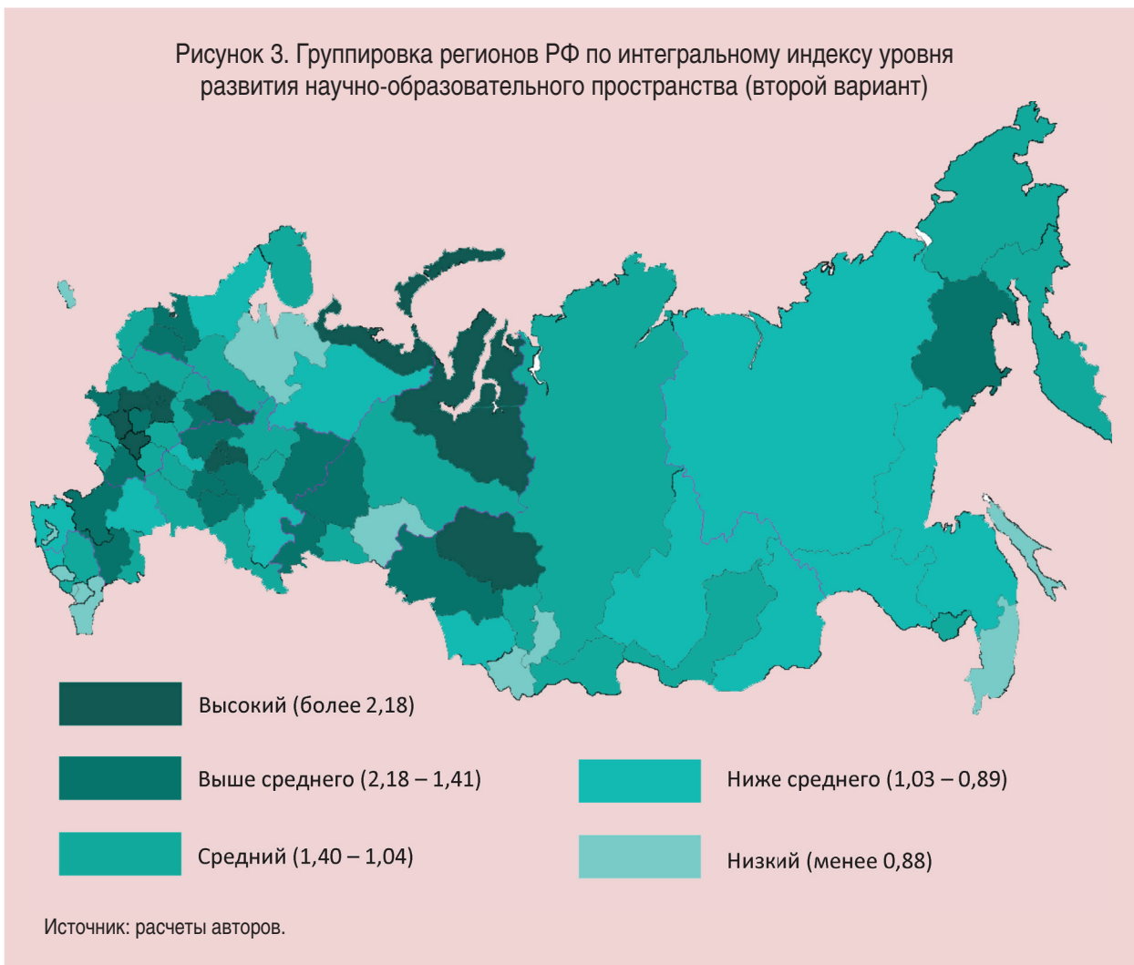
Рисунок 3. Группировка регионов РФ по интегральному индексу уровня развития научно-образовательного пространства (второй вариант)

Петербург, республики Марий Эл и Чувашия, Томская, Московская, Липецкая, Калужская, Орловская, Костромская области, Ненецкий автономный округ (рис. 3). По интегральному индексу Москва заметно опережает все остальные регионы России (разница с г. Санкт-Петербургом составляет 32%).