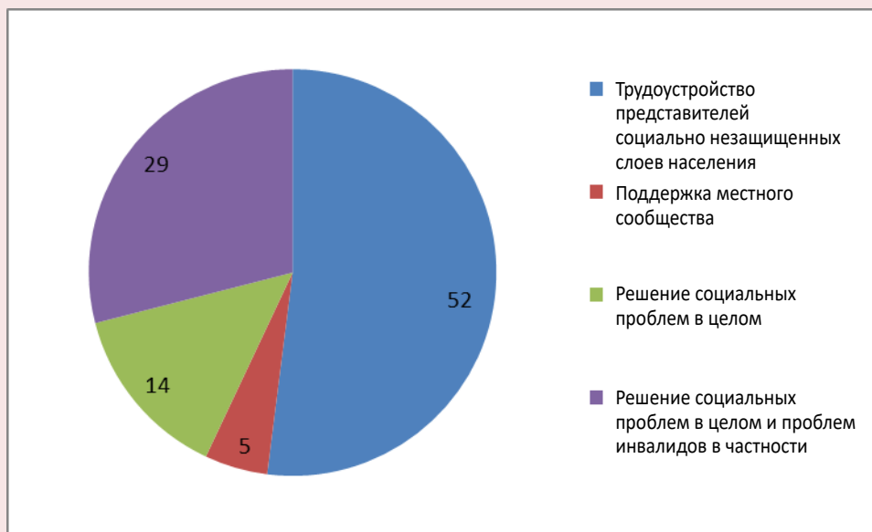
Рис. 4. Общественно полезная цель как характеристика социального предпринимательства и ее достижение в соответствии с ответами людей с ограниченными возможностями, % (на основе ответов 47 человек)