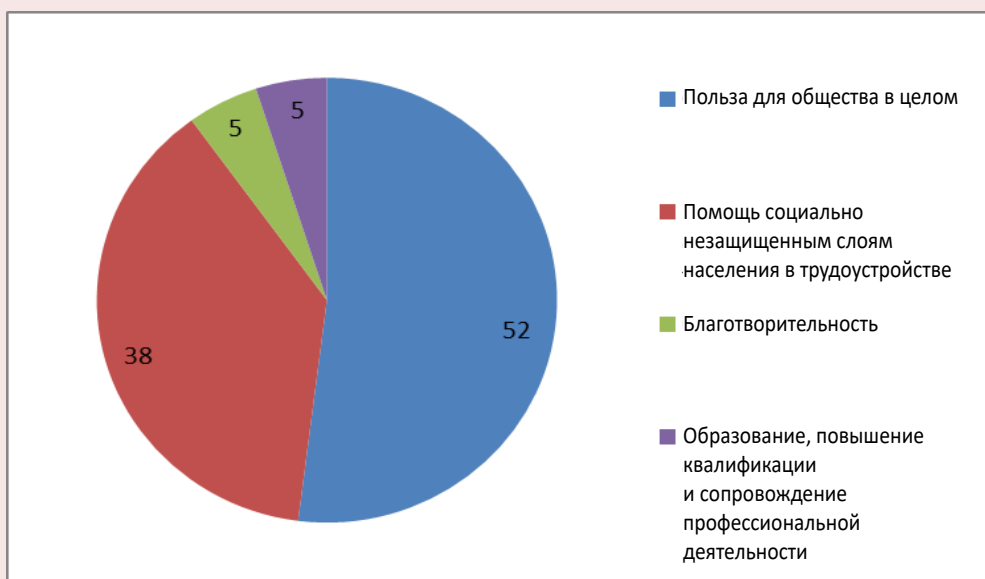
Рис. 2. Служение общественным целям как характеристика социального предпринимательства и их достижение в соответствии с ответами опрошенных студентов, % (на основе ответов 21 студента)

Большинство опрошенных считают, что человеку с ограниченными возможностями трудоустроиться очень сложно (табл. 10). Этот результат согласуется с выводом, сделанным