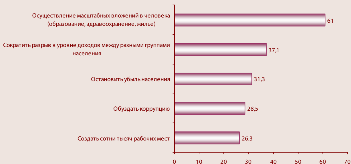
Рисунок 1. Какие из поставленных В. Путиным задач Вы считаете наиболее актуальными для России? (в анкете был представлен список из 14 задач, на рисунке – только первая пятерка)

В апреле 2008 года Вологодским научно-координационным центром ЦЭМИ РАН был проведен опрос жителей Вологодской области, который показал, что более половины их (61%; рис. 1 ) считают наиболее актуальной для России задачей (из заявленных в Стратегии) осуществление масштабных вложений в человека (образование, здравоохранение, жилье).