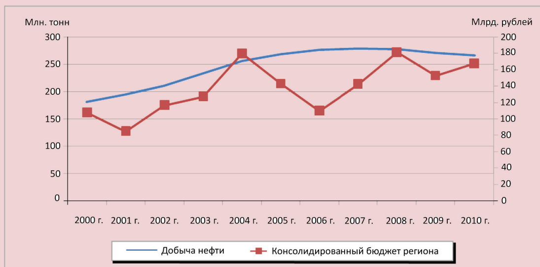
Рисунок 1. Динамика добычи нефти и доходы консолидированного бюджета Ханты-Мансийского автономного округа за 2000 – 2010 гг. [2]

В структуре бюджета Ханты-Мансийского автономного округа налоговые поступления занимают почти 90%. В 2010 г. первое место в структуре налоговых доходов занимал налог на прибыль организаций – 36,5%. Увеличение цены на нефть с 60,74 доллара за баррель в 2009 г. до 78,05 доллара за баррель в 2010 г. повлекло за собой увеличение консолидированного бюджета Ханты-Мансийского автономного округа на 9241,7 млн. руб. Приведенные данные свидетельствуют об устойчивой зависимости экономики Ханты-Мансийского автономного округа от ситуации в нефтегазовом секторе.