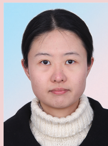
ХУА ЛИ Чжэцзянский университет Ханчжоу, провинция Чжэцзян, Китай, Mengminwei Building, room 257, Zijingang Campus, Zhejiang University E-mail: lilylovesresearch@163. com

Аннотация. В настоящее время в постоянно изменяющихся социально-экономических условиях одним из важнейших направлений национального и регионального развития является поддержание социальной стабильности и воспроизводство качественного человеческого капитала. В рамках достижения данной цели значимую роль играет создание условий для эффективной реализации человеческого потенциала. В то же время мировая практика показывает, что регионы