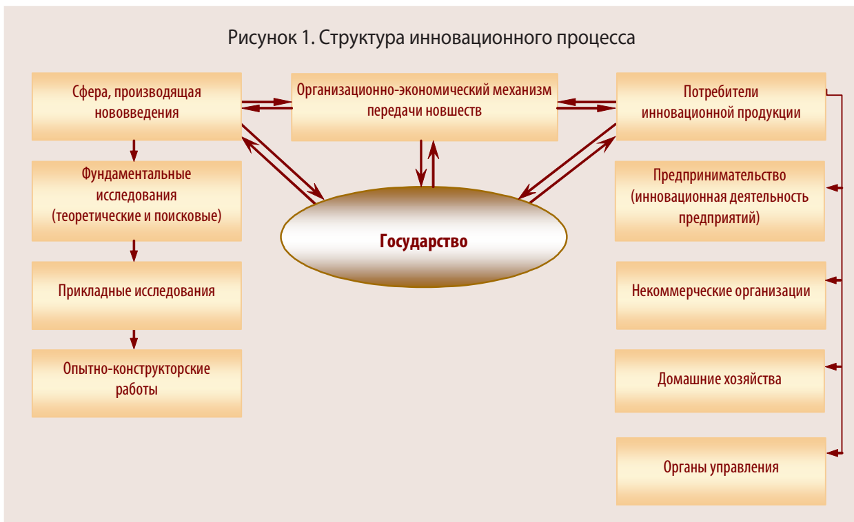
Рисунок 1. Структура инновационного процесса

По направленности результатов инновации делят на продуктовые и процессные. Продуктовые инновации охватывают внедрение новых или усовершенствованных продуктов. Они включают применение новых материалов, новых полуфабрикатов и комплектующих, получение новых продуктов. Процессные инновации делятся на технологические — новые технологии