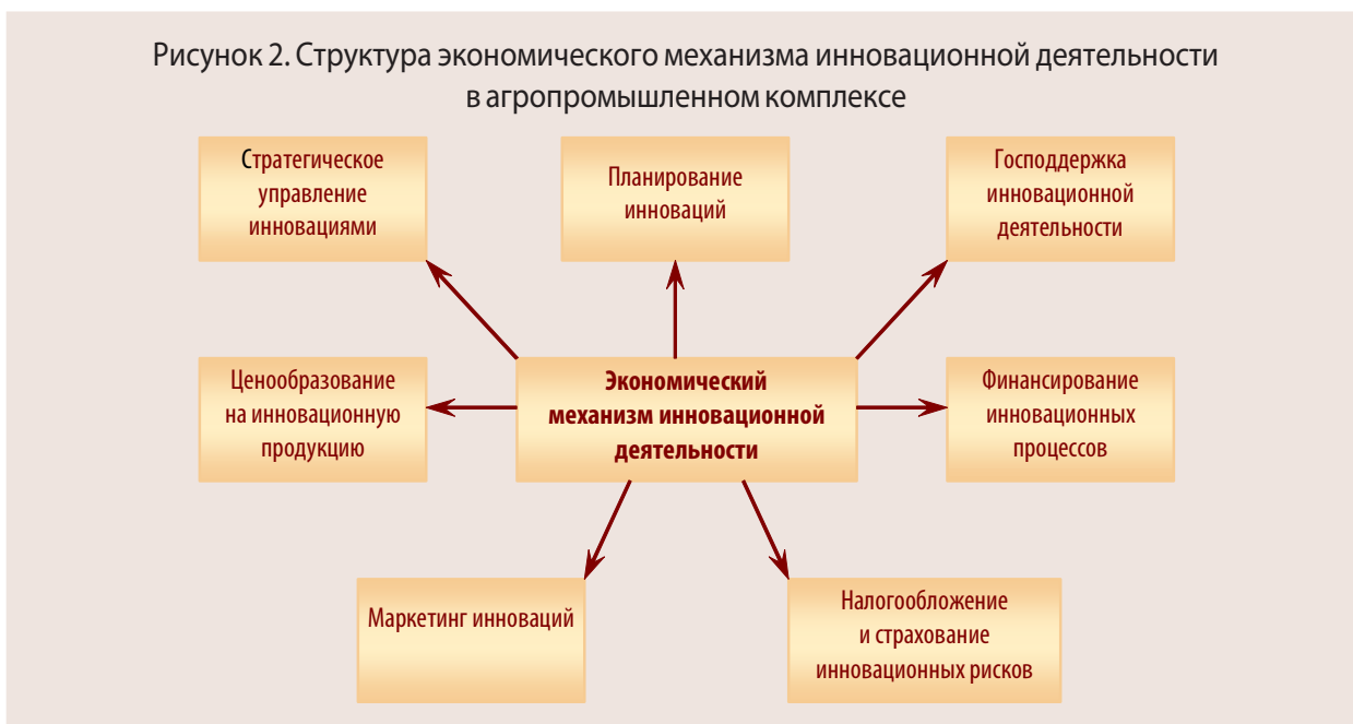
Рисунок 2. Структура экономического механизма инновационной деятельности в агропромышленном комплексе

питательного вещества сверх потребности животного не приведет к повышению его продуктивности. Комплексный характер инноваций в АПК предъявляет специфические требования к инновационному механизму (рис. 2).