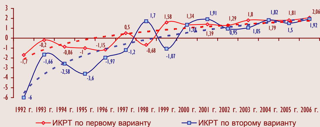
Рисунок 6. Динамика интегрального критерия развития территории Республики Карелия

Динамика интегрального критерия по обоим вариантам представлена на рисунке 6 , при этом значения рассчитаны за весь прошедший период рыночных реформ.