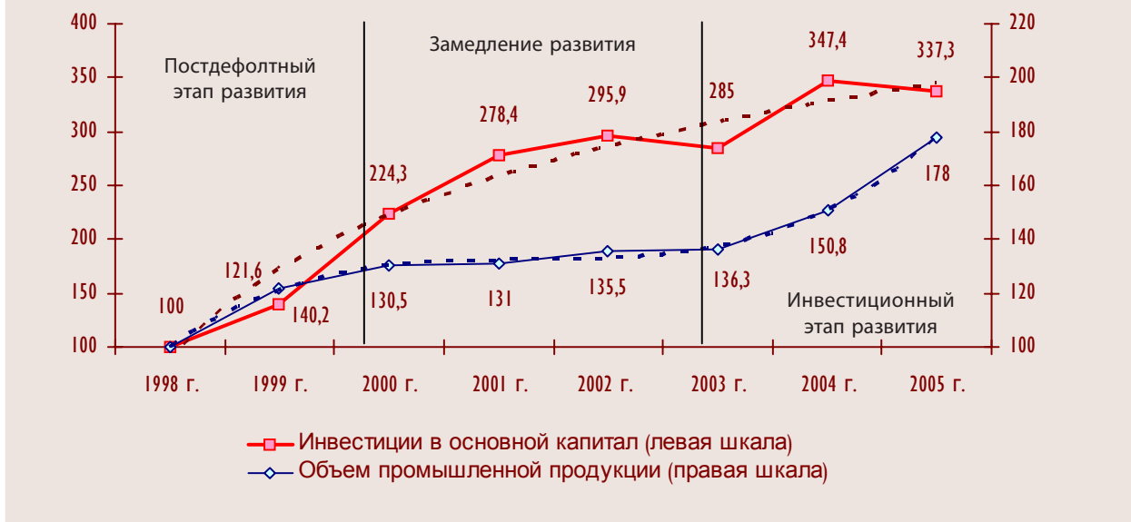
Рисунок 8. Основные этапы развития экономики Республики Карелия (показатели в % к 1998 г.)

2. Все важнейшие решения принимались после широкого обсуждения в СМИ и на круглых столах общественно-политических сил, а конституционные изменения – по результатам референдума.