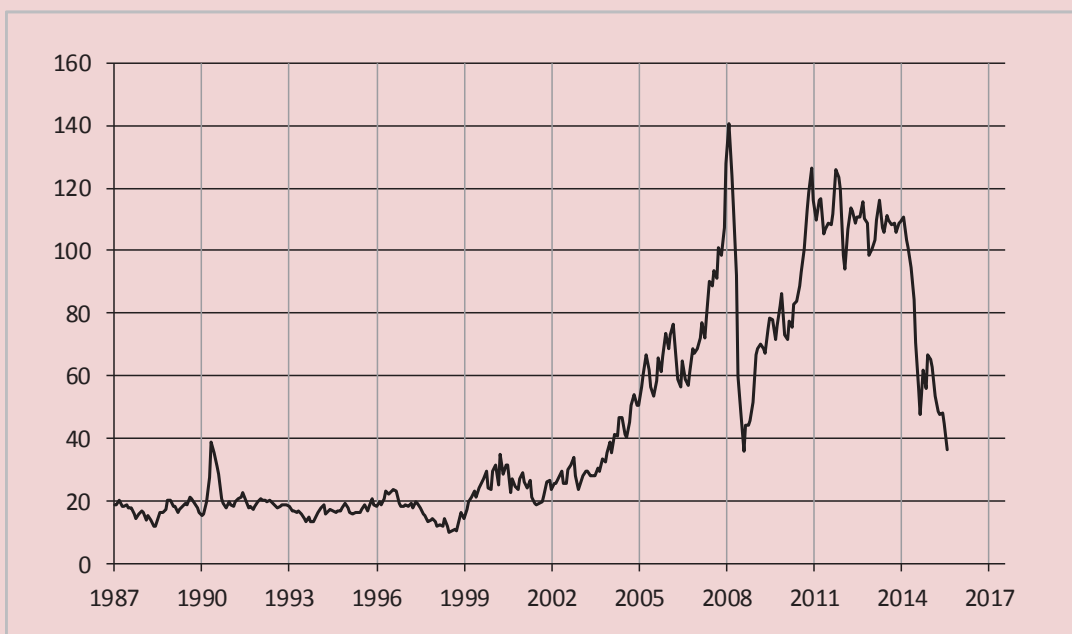
Рисунок 3. Цены на нефть марки Brent за последние 28 лет