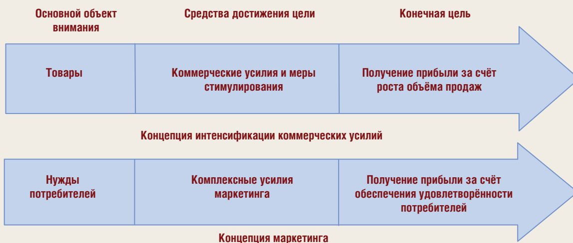
Рисунок 1. Сопоставление концепций продвижения продукции на рынок

Первая особенность – жёстко детерминированный характер спроса при повышенных требованиях потребителей к качеству машин и оборудования, которые приобретаются по строго целевому назначению и для изготовления определённых видов продукции. Жёсткость технических требований со стороны потребителей порождает зависимость и долгосрочность отношений продавца и потребителя. Например, производственные потребители обращаются к поставщикам машин и оборудования, когда возникает необходимость встраивания машины в существующий технологический поток, адаптации её к специфическим нуждам производства. Отказ от сотрудничества с поставщиком машин вынуждает произ-