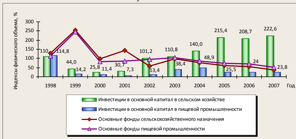
Рисунок 2. Индексы основных показателей инвестиционной деятельности АПК Республики Коми

техники и оборудования. В результате при незначительном темпе роста инвестиций в основной капитал произошло снижение физического объёма фондов в производство, что не характерно для процессов расширенного воспроизводства и активного участия предприятий в финансовых, товарных и других рынках (рис. 2).